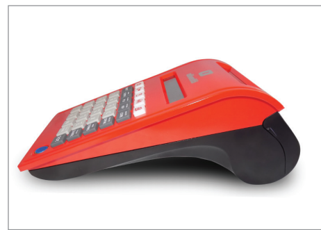
Forma compatta, linee curate e moderne