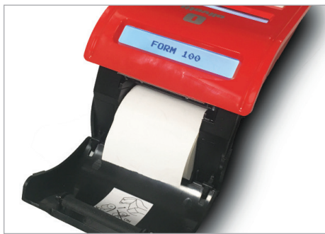
Inserimento rapido e agevole del rotolo carta